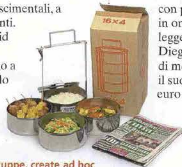
Soups-zuppe, create ad hoc dall'artista contemporaneo thailandese, Rirkrit Tiravanija.

Per chi ama il mondo e non avesse il tempo per viaggiare, ma molto spazio in casa, il Globo rotante , firmato Tod's , realizzato dal creativo pugliese Felice Limosani , che si è divertito a disegnare i continenti con piccole gomme per cancellare, in omaggio ai gommini ormai leggendari di casa Tod's, del patron Diego Della Valle, esempio massimo di mecenatismo contemporaneo, per il suo impegno pari a 25 milioni di euro a favore del Colosseo.