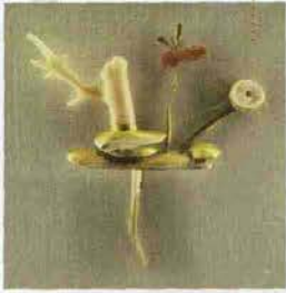
Porta candele della nuova collezione Petit H di casa Hermes, realizzato utilizzando materiali di scarto.