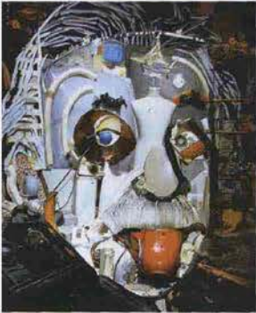
Ritratto tridimensionale disegnato dal francese Bernard Pras, ispirandosi ad una creatività ecologica.