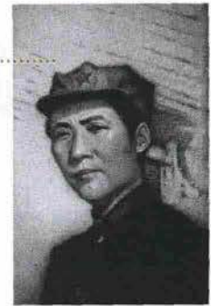
Opera realizzata con la cenere sulla tela dall'artista Zhang Huan.