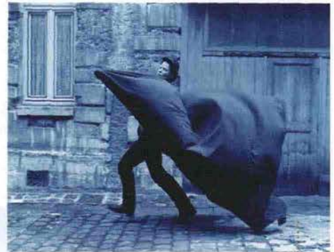
Tom Waits